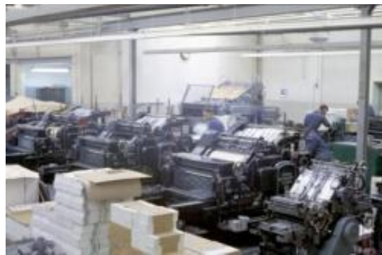
Het interieur van de drukkerij van Van Poll Suikerbuyk in Roosendaal.

Synghel. Indien er belangstelling is voor het meewerken aan vertalingen, dan worden speciaal daarvoor Latijnse teksten geselecteerd. Alle vertalingen worden online aangeboden in open access op de website van het Digitaal Oorkondenboek van Noord-Brabant , www.donb.nl . Leden die iets aan willen melden, kunnen dat via email: geertrui.van.synghel@huygens.knaw.nl . Of telefonisch bereiken op 073.5516647 of 06.26814726.