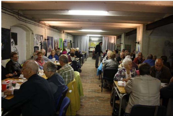
Koffiedrinken onder de kapel van de landloperskolonie

We begonnen het bezoek met uitleg van één van de mensen die zich inzetten voor het behoud van de historische kapel waar de collectie in ondergebracht is. Die kapel is helemaal intact gebleven, al is er wel het nodige aan gerestaureerd. De kapel is in gebruik als feest- en evenementenzaal. Wij gingen de 'kelder' in waar we koffie en een boterham met spijs kregen.