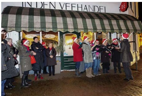
Een koor zorgt voor stemmige muziek voor eetcafé 'In den Veehandel'