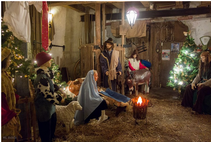
De kerststal in molen De Arend

Verder zijn de voorbereidingen voor de activiteiten van 'Wouw rondom kerst' in volle gang. Een nieuwe aanpak, twee jaar geleden voorzichtig begonnen vanuit 'De Vierschaer' samen met de VVV, heeft thans geresulteerd in een gezamenlijk naar buiten treden van diverse belangengroeperingen en verenigingen met als doel de totale kerstsfeer in Wouw meer gestalte en uitstraling te geven. Er wordt hard gewerkt om de financiële begroting sluitend te krijgen middels sponsoring.