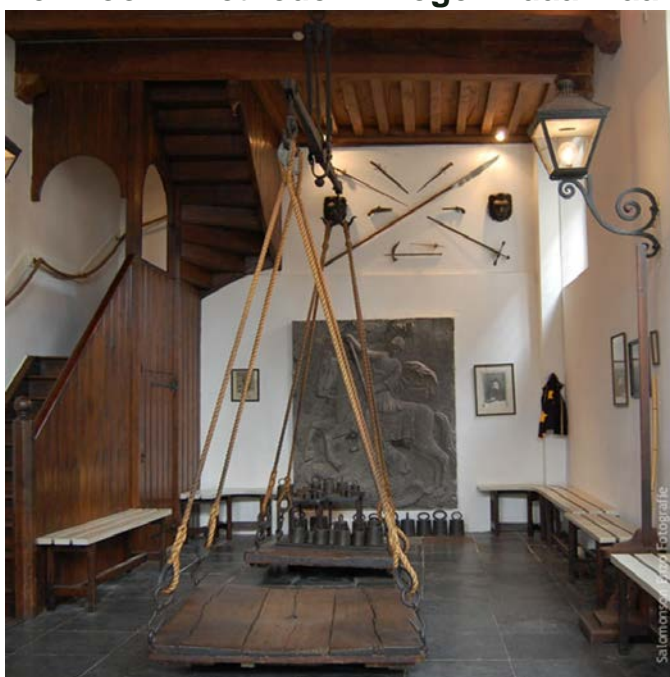
De Heksenwaag in Oudewater