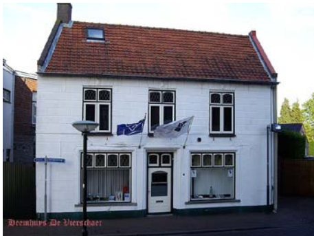
Het Heemhuys toen wij er in 2013 in trokken