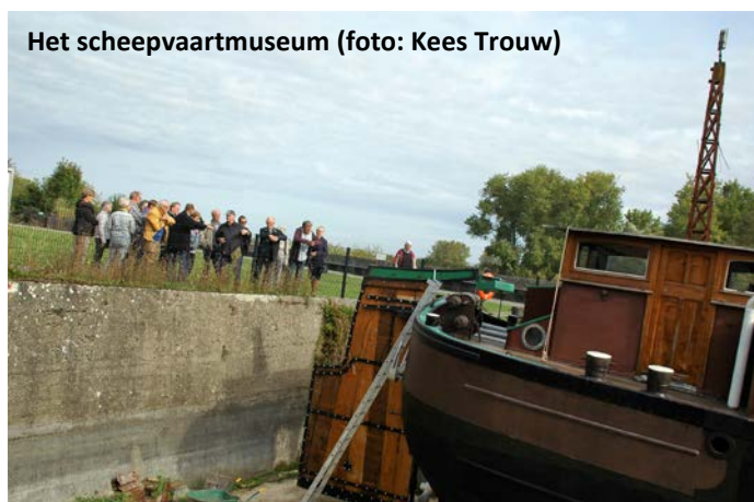
Het scheepvaartmuseum

Op zaterdagmorgen 22 september gingen we om half negen met 55 personen op pad naar Dendermonde. Een niet al te lange rit waardoor we rond kwart voor tien bij het eerste doel van deze excursie arriveerden: het Scheepvaartmuseum te Baasrode, gelegen aan de Schelde en de Dender.