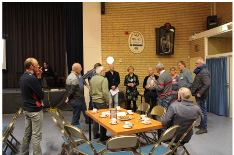
Werkoverleg voor het begin van de quiz

Tot slot wenst het bestuur van 'De Vierschaer' u allen een mooie feestmaand december toe, een goede jaarwisseling en alle goeds voor 2019 in een vooral goede gezondheid.