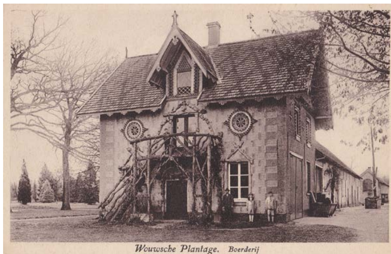
Wouwse Plantage. Boerderij

De rondleiding begint elke keer om 14.00 uur en duurt tot 15.30 uur. Het vertrekpunt is Plantage Centrum. De ingang daarvan ligt aan de Plantagebaan tussen Wouwse Plantage en Huijbergen. Op ongeveer 2,5 km vanaf het dorp Wouwse Plantage staan aan de